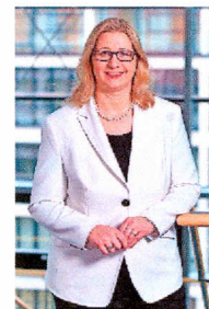
Anke Rehlinger

Mit freundlichen Grüßen Anke Rehlinger Ministerin für Wirtschaft, Arbeit, Energie und Verkehr